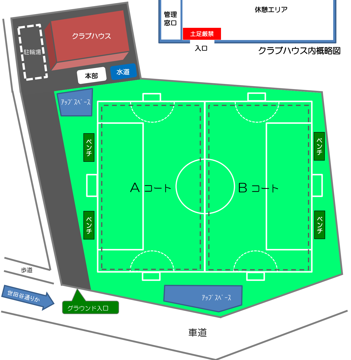
クラブハウス内概略図