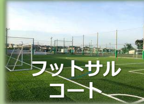
フットサル コート