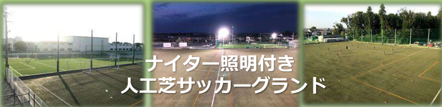
ナイター照明付き 人工芝サッカーグラウンド