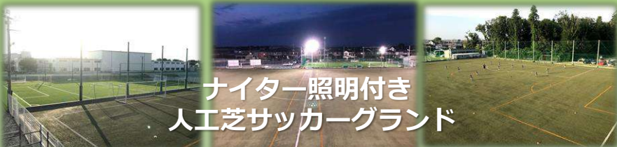
ナイター照明付き 人工芝サッカーグラウンド