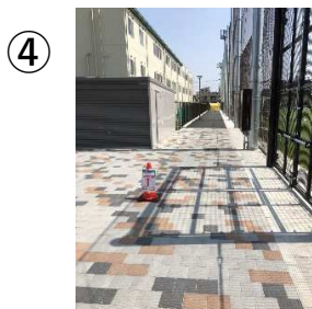
④ 東京都立水元小合学園側 チーム待機場所 多目的広場側 観戦場所