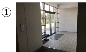
① 東側玄関（体育館内より撮影）