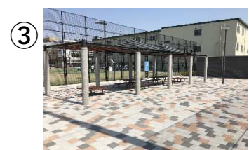
③ 屋根付きベンチは トラブル防止の為に 使用を控える